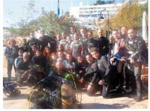
Seminari de Biologia Marina (Mar Menuda / Tossa de Mar)

Tallers gratuïts: periòdicament al club convoquem tallers específics