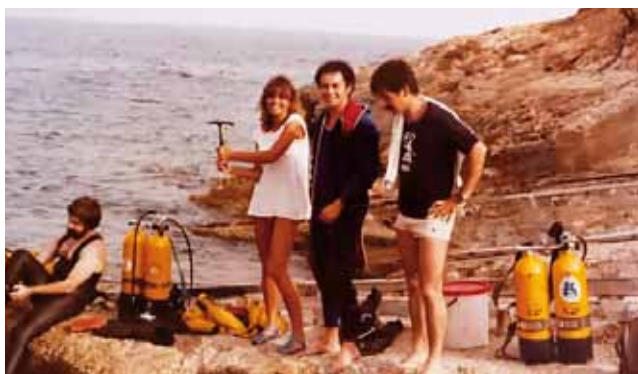
Primeres immersions, trenta anys enrera.